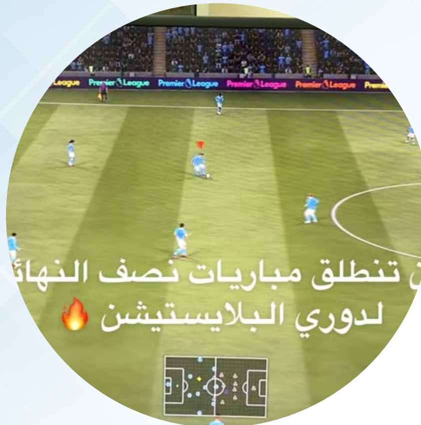
من تنطلق مباريات نصف النهائي لدوري البلايستيشن 🔥