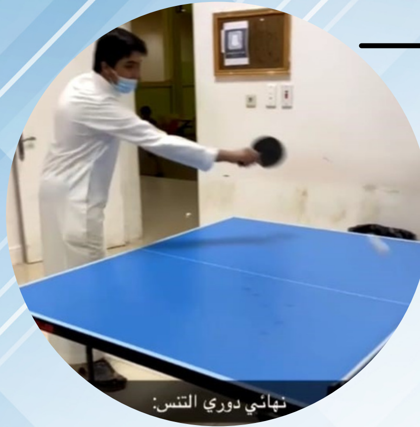
نهائي دوري التنس: